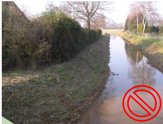
Eine Befahrung der Böschung ist nicht möglich

Ausnahmen von den Beschränkungen dieser Vorschrift kann der Geschäftsführer des Mittelweserverbandes in begründeten Fällen zulassen.