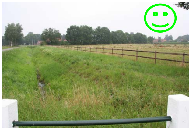
Auf dem breiten Randstreifen ist eine Befahrung sehr gut möglich

In diesen Fällen sollten Sie sich vor Errichtung solcher baulichen Anlagen oder Anpflanzungen mit der Geschäftsstelle des Mittelweserverbandes in Verbindung setzen.